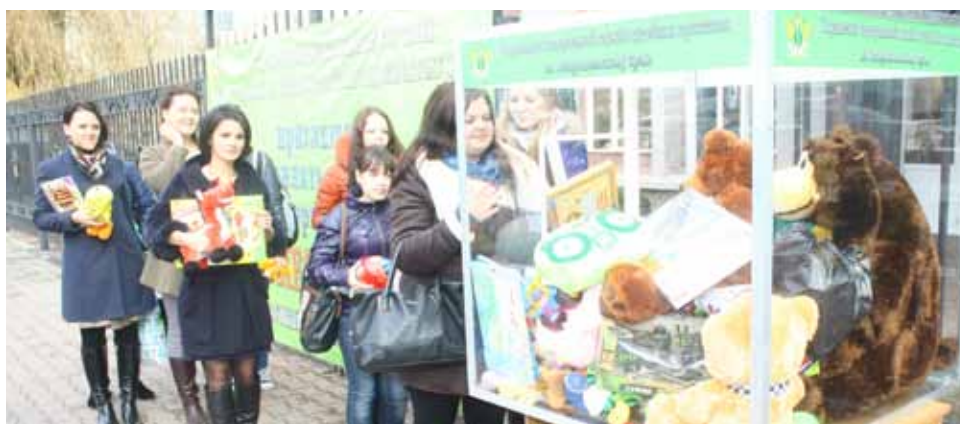
Преподаватели и студенты Северо-Кавказского федерального университета участвуют в акции «Все вместе-детям».