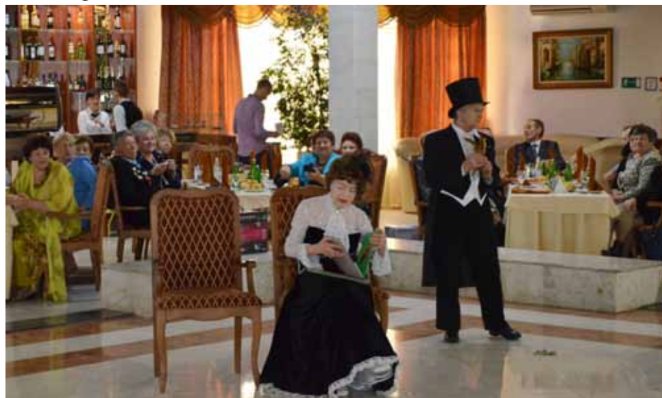
В творческом вечере приняли участие талантливые ставропольцы: певцы, танцоры, поэты и мастера прикладного творчества.