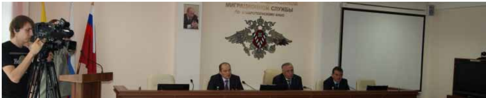
Брифинг, посвященный ходу реализации госпрограммы переселения соотечественников из-за рубежа.

23 сентября 2014 г. Постановлением Правительства Ставропольского края №382-п утверждена подпрограмма «Оказание содействия добровольному переселению в Ставропольский край соотечественников, проживающих за рубежом» государственной программы Ставропольского края «Социальная поддержка граждан».