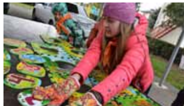
Каждый раз ребята из «Надежды» поражают своих шефов новыми идеями, талантами и костюмами.