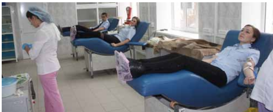
Судебные приставы ставропольских городских отделов сдают кровь.