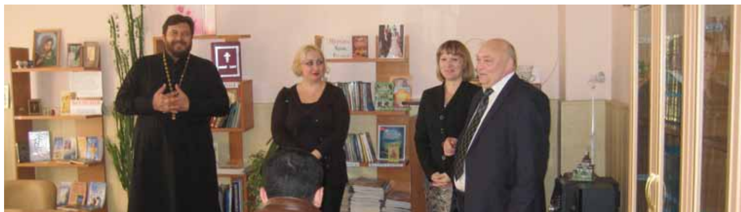
Открытие курсов по изучению русского языка в Спасо-Преображенском соборе г. Изобильного.

В связи с введением с 1 января 2015 года обязательного экзамена по русскому языку, истории России и основам законодательства РФ для иностранных граждан, желающих оформить разрешение на работу, патент, разрешение на временное проживание, вид на жительство, УФМС России по Ставропольскому краю проводит совместную с религиозными конфессиями работу по открытию бесплатных курсов, которые помогут мигрантам повысить уровень владения русским языком.