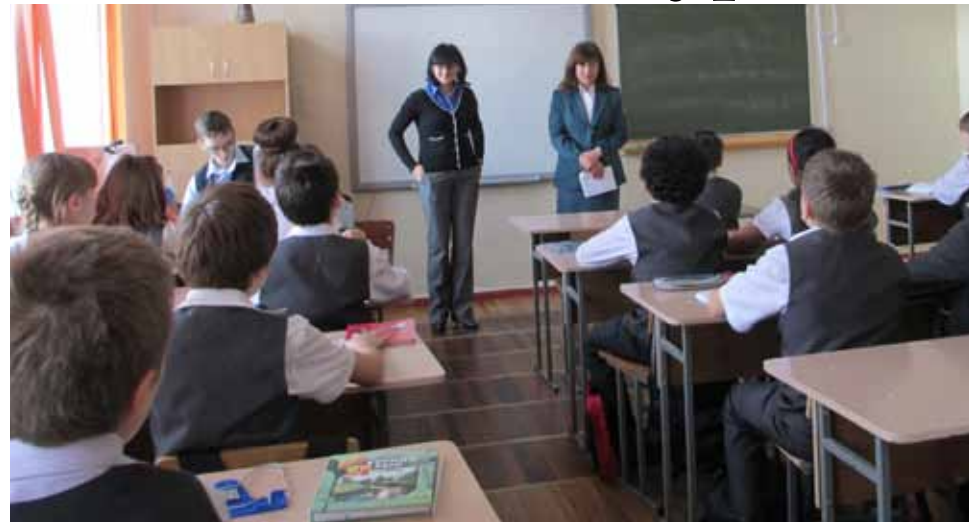
Для учеников средних классов уроки налоговой грамотности проводятся в игровой форме.

Ставропольские школьники попробовали перевоплотиться в законодателей и налогоплательщиков. В четырнадцать школах края прошли уроки налоговой грамотности, в них приняли участие более пятисот учеников. Акция проводится налоговыми органами страны ежегодно с целью формирования финансовой грамотности детей и подростков. Немаловажно и то, что подобные мероприятия позволяют заложить основы гражданской ответственности юных членов общества.