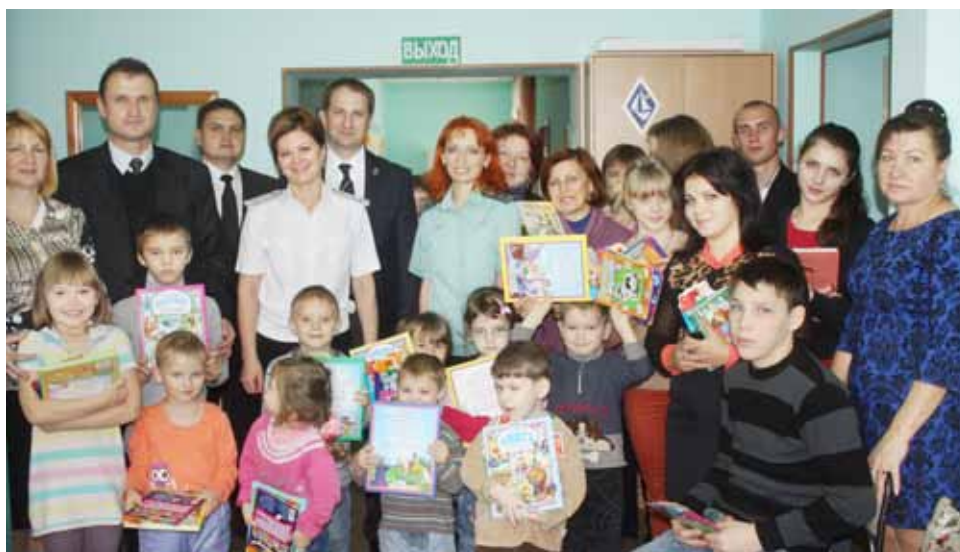
Руководство Управления судебных приставов, члены Общественного совета, студенты молодежного движения «Перспектива» и воспитанники приюта «Росинка».